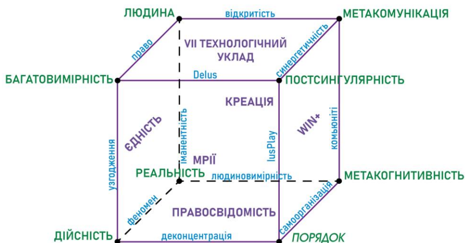
Рис. 2 – Багатовимірна структура тез на базі Платонова тіла

В якості виводов сутність тез представлена як об'ємна багатовимірна нелінійна структура з урахуванням Платонова тіла, де слова не є взаємозалежними одне від одного, а поєднуються одне з одним у багатовимірності.