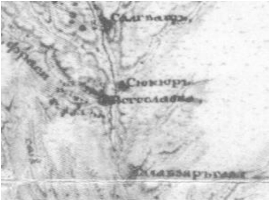
Фрагмент карти Ф. П. де Волана 1791 р. [5]

адміністрації. Велика Михайлівка (Гросулово) – була заснована у 1826 р. на місці де були турецькі(татарські) та українські (козацькі) села. Наш дім виник не на пустому місці. Також актуальною буде нова логічна лінія заснування Великої Михайлівки: Су-Кюр > Михайлівка > 1796: наділ землі > 1826: Гросулово > 1945: Велика Михайлівка.