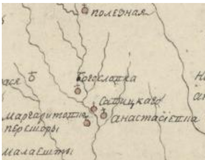
Фрагмент «Общая карта Екатеринославского и Вознесенского намечничества...» 1796 р. [5]