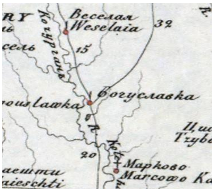
Фрагмент «Карта Херсонской губернии» 1821 р. [5]