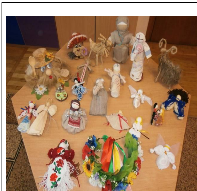
Фото (виставки, заняття, свята)