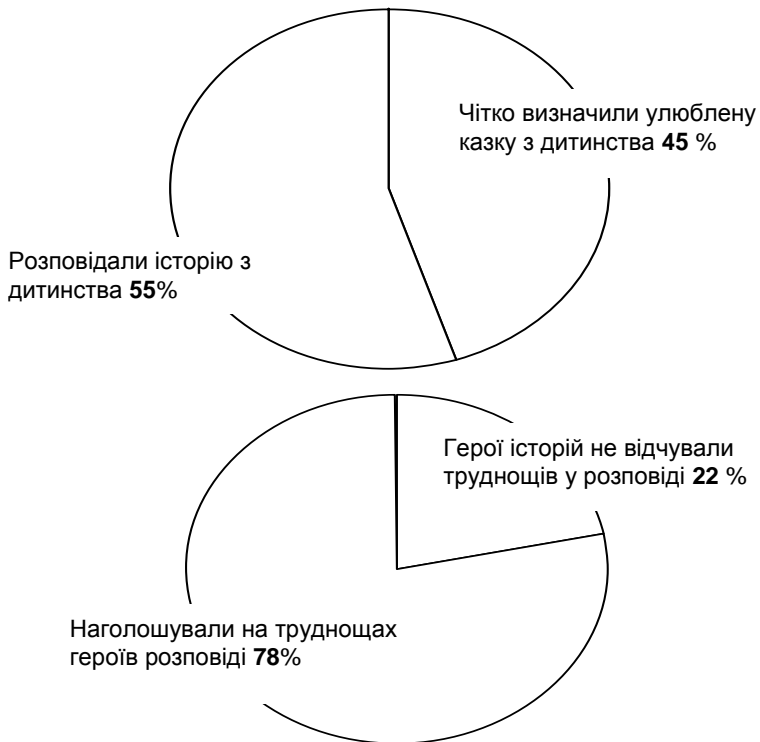
Рис. 2. Узагальненні результати відповідей на питання другого блоку запитань анкети