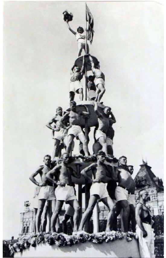
Лл. 2 О. Родченко. Чоловіча піраміда. 1936