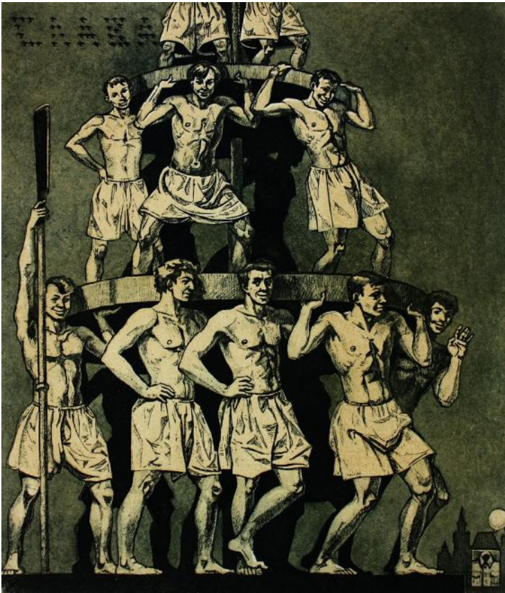
Лл. 1. В. Сфименко. Тридцяті роки. Ілюстрація до «Майстра і Маргарити» М. Булгакова. 1978–1992. Офорт