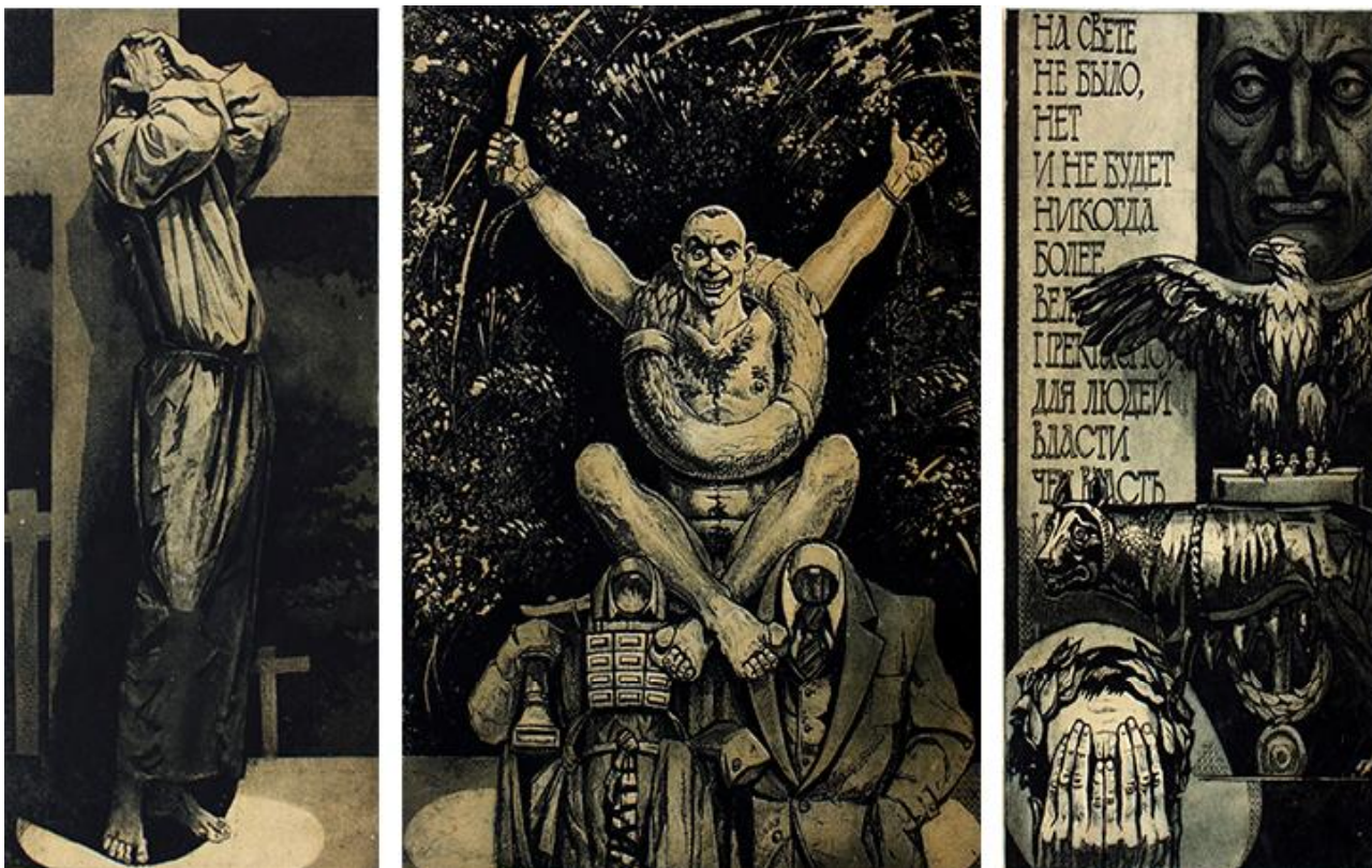
Іл. 4. В. Єфименко. Триптих «Тріумф Вар-раввана, або Ідея небезпечніша від будь-якого злочину». Ілюстрація до «Майстра і Маргарити» М. Булгакова. 1978–1992. Офорт