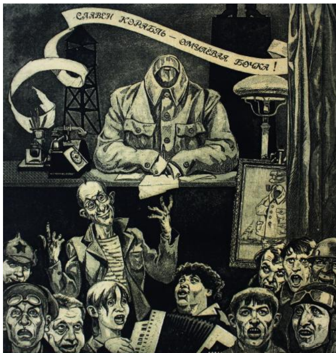
Іл. 5. В. Єфименко. Море славетне священний Байкал! Ілюстрація до «Майстра і Маргарити» М. Булгакова. 1978–1992. Офорт