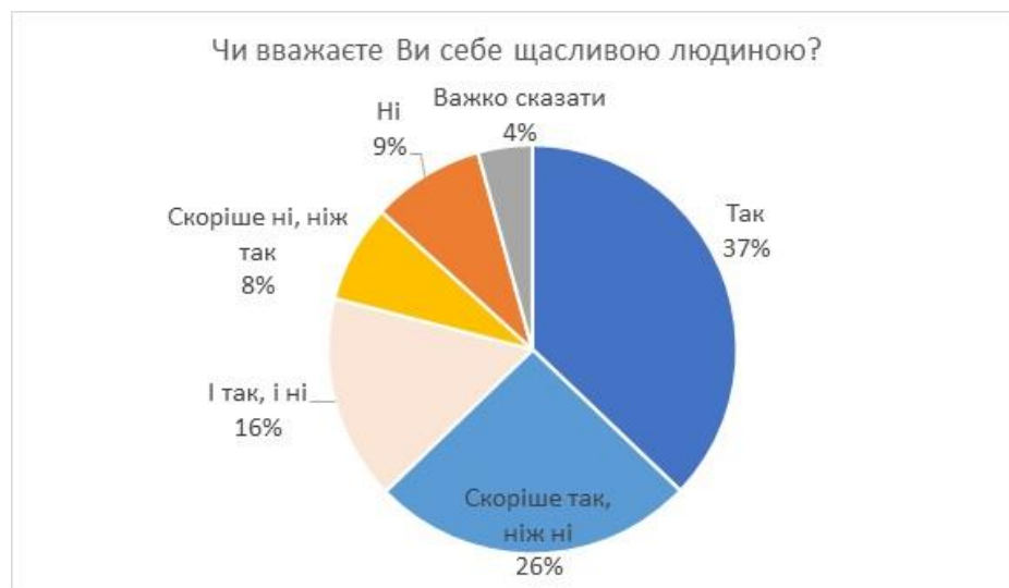
Рис. 2. Результати опитування щодо самооцінки відчуття щастя громадян України [3]

Таким чином, щастя являє собою комплекс індивідуальних та соціальних властивостей та якостей соціалізованої особистості, що мають одночасно суб'єктивну та об'єктивну основу. Суб'єктивний компонент щастя виявляється у його здатності служити психічному благополуччю особистості, коли під благом розуміються як духовні, і матеріальні цінності, і навіть розкриття її духовного (творчого) потенціалу, у зв'язку з чим актуальним стає питання соціалізуючи природу щастя. Об'єктивний компонент щастя включає панівну у цьому суспільстві культуру, які у ньому соціально-культурні норми, у результаті дії яких щастя виявляється вигідним індивіду і стає однією з основних цілей державної соціальної політики.