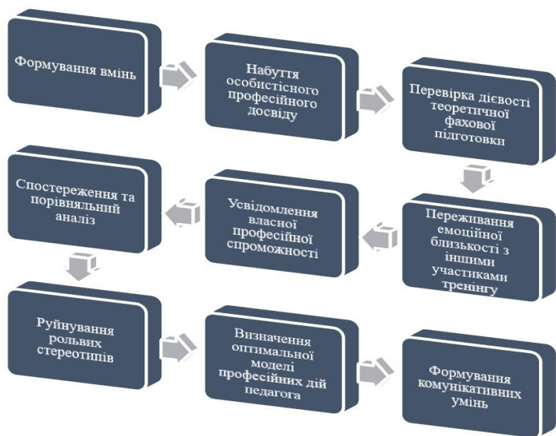
Рис. 3. Реалізація основних завдань у процесі проведення тренінгів