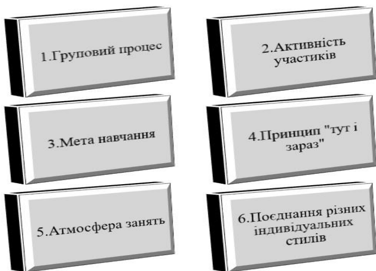
Рис. 1. Особливості тренінгу як форми діяльнісного навчання

Тренінг як форма професійної підготовки педагогів, включає низку організаційних блоків.