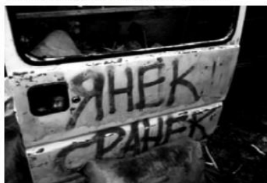
Мал. 2. Вул. Хрещатик, 2014 р. Фото зі сторінки спільноти «Українська революція». – [Електронний ресурс]. – Режим доступу: http://vk.com/revolution_ukrainian