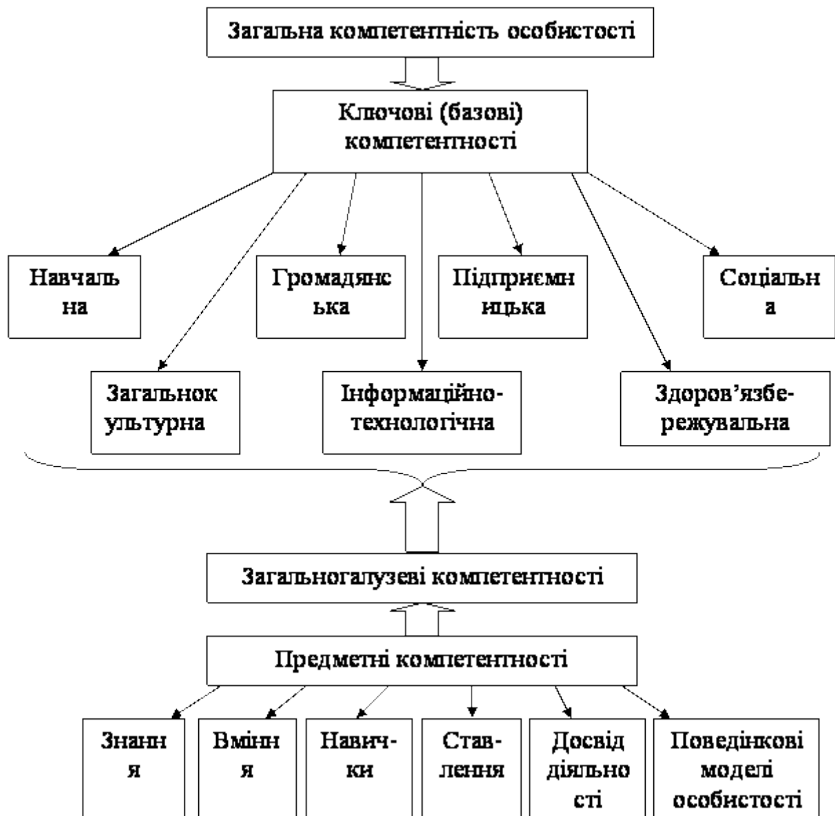
Рис. 1. Схема загальної компетентності особистості

Так, діяльнісно-функціональна компетентність характеризується сукупністю наступних складників: