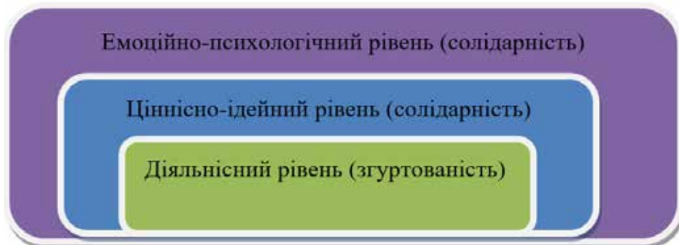
Рис. 1. Соціальна солідарність та соціальна згуртованість у реляційній візуалізації

«Вихід» соціальної солідарності з латентної фази відбувається завдяки спільним діям агентів, що засновані на самоорганізаційних механізмах та у подальшому призводять до координації та структурування – основи легітимації та інституціоналізації в логіці теорії структурації Е. Гідденса. Фактично дослідники пояснюють якісний перехід солідарності зі спільнотою, що завдяки самоорганізації та спільним практикам стає солідарністю спільноти, (ре)конструюючи в такий спосіб соціальну реальність. Незважаючи на те що діяльнісний аспект «виводить» соціальну солідарність із латентної фази, роблячи її стійкою та тривалою, він не є обов'язковим її атрибутом. Це актуалізує проведення ймовірної демаркаційної лінії між соціальною солідарністю (як, перш за все, феномену рівня свідомості) та соціальною згуртованістю (як, перш за все, діяльнісного феномену). Якщо М. Красько чітко визначає «точку переходу» солідарності у згуртованість (спільні узгоджені практики), то у І. Мартинюка та Н. Соболевої вона не є чітко визначеною, проте логічно конструюється як результат згуртування у площині соціальних практик. Для обох концепцій актуальним є висновок щодо позиціонування соціальної згуртованості як діяльнісного результату розвитку соціальної солідарності .