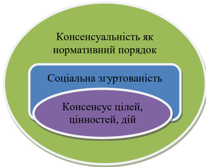
Рис. 2. Соціальна згуртованість та соціальний консенсус у реляційній візуалізації

ваності, що може конструюватися не лише на основі «відчуття наявності спільних соціальних норм» (нормативний вимір соціальної солідарності за К. Урсуленко [13]), а і в умовах певного нормативного порядку.