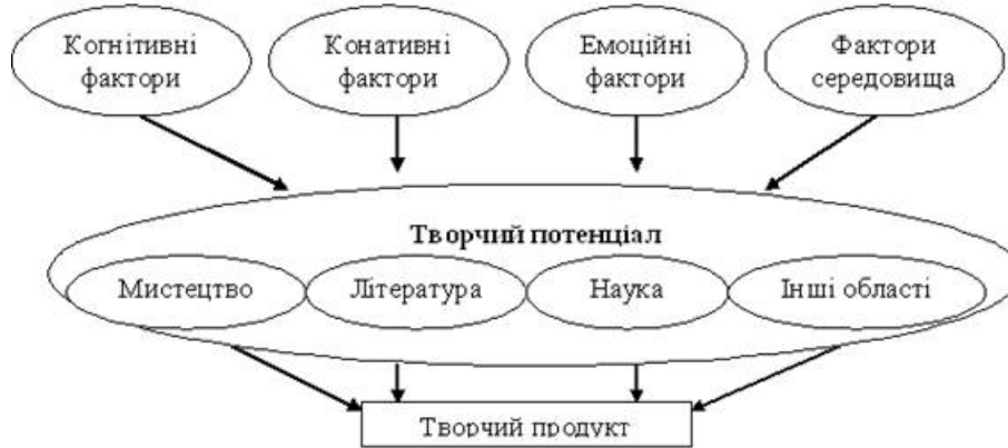
Рис. 1. Структура творчого потенціалу особистості в рамках багатофакторного підходу

Зміст поняття "творчий потенціал особи" О.І. Клепиков та І.Т. Кучерявий [6] розглядають як інтегральну властивість у вигляді здібності, що дає змогу людині здійснювати предметну діяльність. За своїми витокami ця властивість людського індивіда є результатом природної й соціальної активності, зовнішнім виявом якої виступає праця або доцільна діяльність, що органічно включає свідомість і спілкування, які проявляються у формі пізнавальної та комунікативної діяльності. Здатність до творчості невіддільна від здатності до праці. Творча активність історично виникає з трудової активності, формуючись і розвиваючись на її основі. Праця - її зміст, характер, ставлення до неї - обумовлює розвиток особистості [6, с. 39].