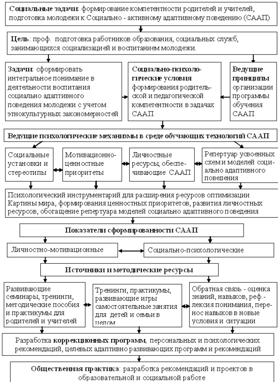
Рис. 1. Программа формирования и коррекции социально адаптивного поведения подростков

Ведущие психологические компоненты в среде обучающих технологий СААП.