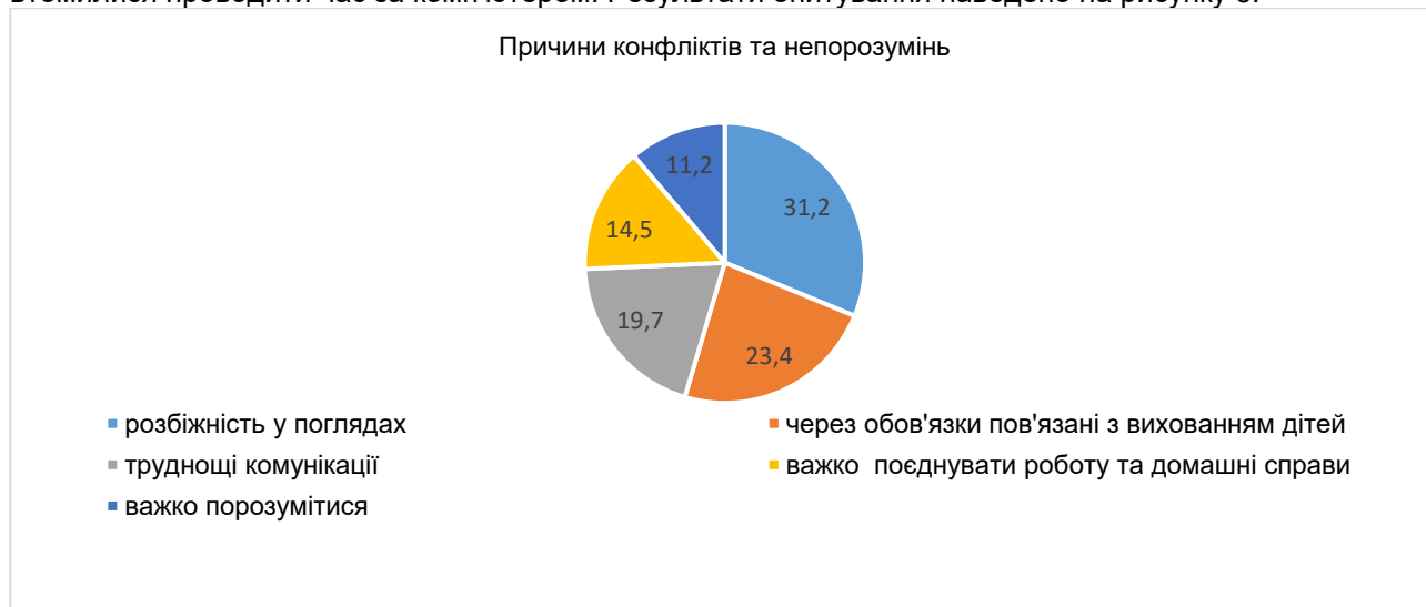
Рис. 3. Причини конфліктів та непорозумінь

порозумітися з дітьми, оскільки у них спостерігається пригнічений настрій, надмірна плаксивість, вони втомилися проводити час за комп'ютером. Результати опитування наведено на рисунку 3.