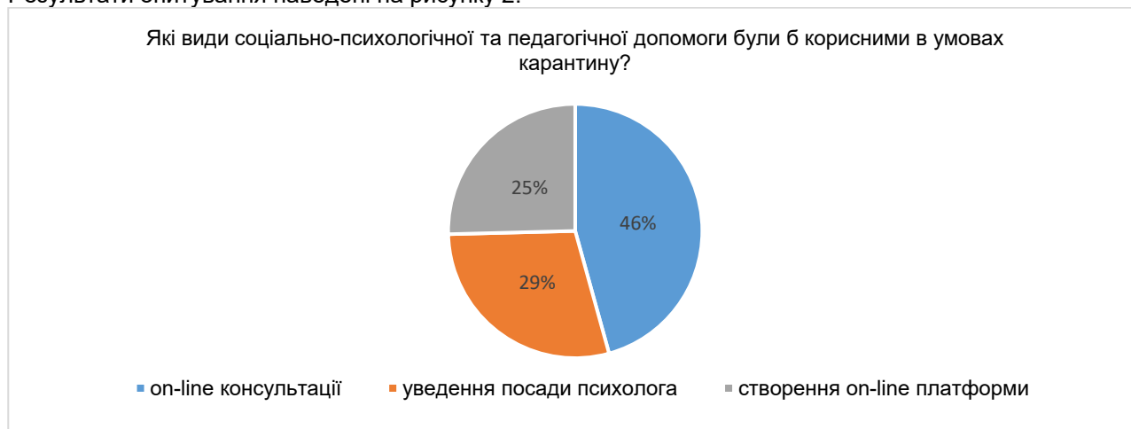
Рис. 2. Види соціально-психологічної та педагогічної допомоги

На запитання анкети «Які види соціально-психологічної та педагогічної допомоги були б корисними в умовах карантину?» отримали такі відповіді: 45,7% зазначили, що дієвим було б надання індивідуальної фахової on-line консультації та підтримки в умовах карантину з різних питань, які виникають у сім'ї та забезпечення доступності цієї послуги на безоплатній основі; 28,9% вважають, що доцільно на підприємствах увести посаду психолога, до якого можна звернутися за допомогою, зняти стрес та роздратованість, отримати корисні поради, психологічну підтримку; 25,4 % вважають за доцільне створення в соціальних мережах (Skype, Viber, Telegram, Instagram, Facebook) провідними фахівцями on-line платформи для спілкування, а також публікування постів на актуальні теми для забезпечення психологічного комфорту та сімейного благополуччя, запобігання конфліктним ситуаціям. Результати опитування наведені на рисунку 2.