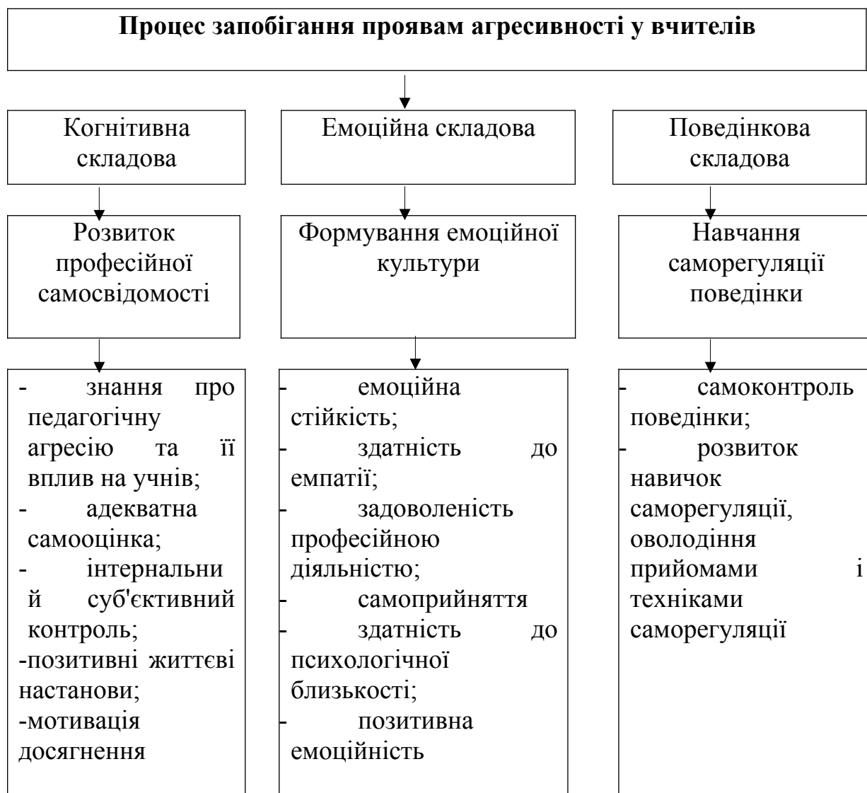
Рис 1. Психологічна модель запобігання проявам агресивності у вчителів

На засадах попередніх досліджень феномену агресії запропоновано психологічну модель запобігання проявам агресивності у професійній діяльності вчителів (рис. 1).