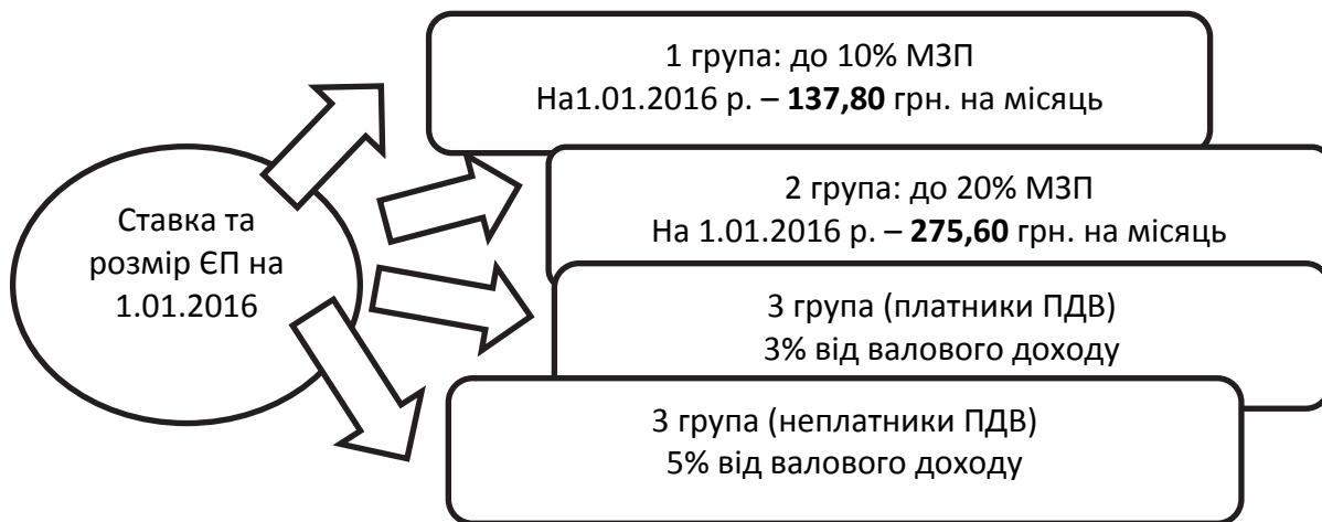
Рисунок 1 – Ставки та розмір єдиного податку

Інформацію про абсолютну величину єдиного податку для різних груп платників станом на 01.01. 2016 рік містить наступна схема.