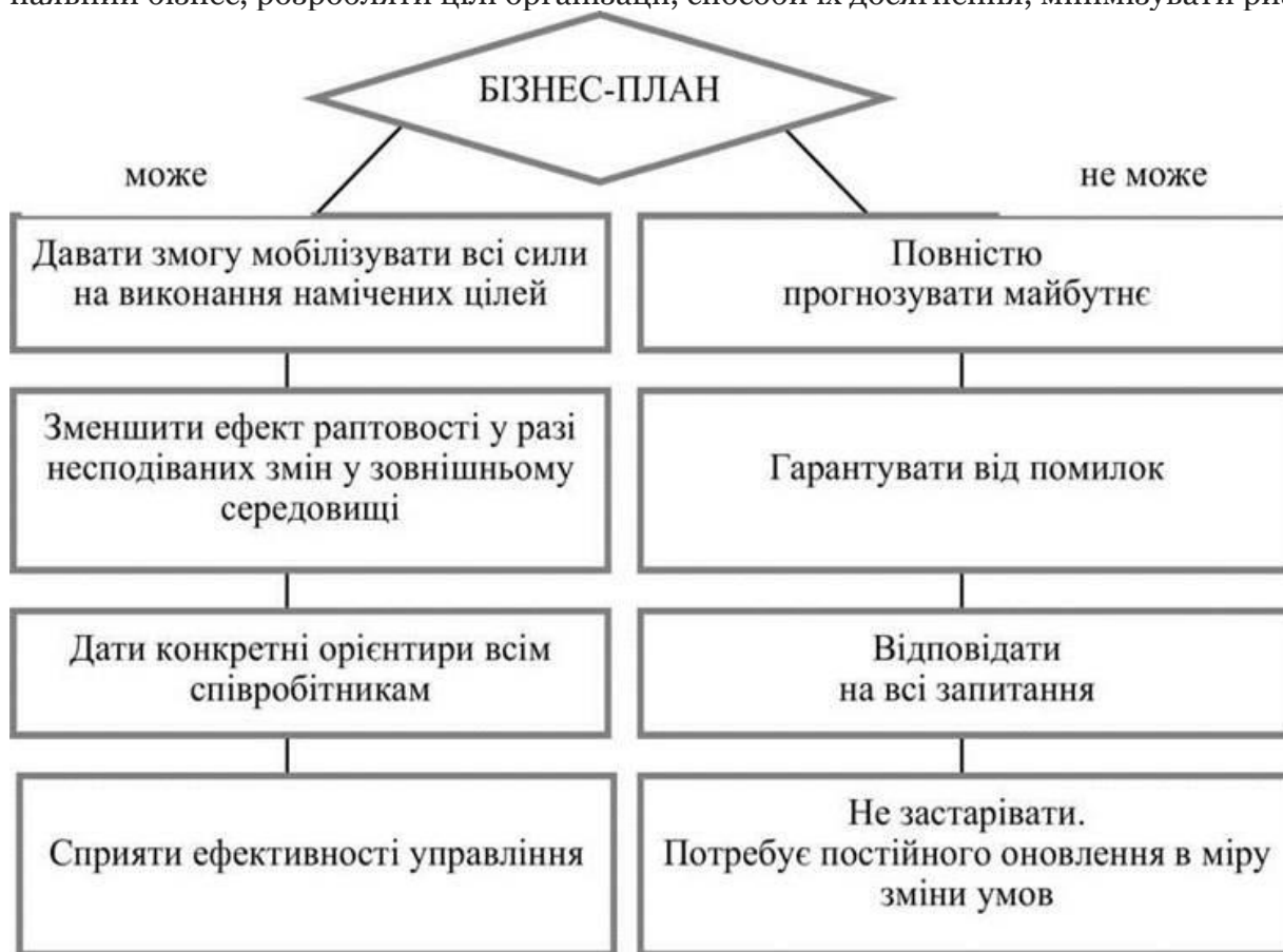
Рис. 1. Можливості бізнес-плану

Загальносвітова практика бізнес-планування є галуззю, в якій менеджмент, планування, макроекономіка, маркетинг, фінансовий і економічний аналіз, соціальна й особиста психологія, системний аналіз, високі технології є взаємозалежними. За кордоном воно давно стало окремою галуззю людських знань, у якій є свої напрями, школи, багаторічні напрацювання, теоретичні й практичні методики. Ефективне використання цих знань дозволяє успішно організувати новий і розширювати наявний бізнес, розробляти цілі організації, способи їх досягнення, мінімізувати ризики.